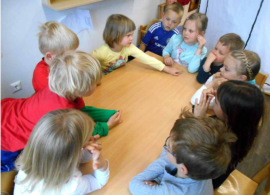
„Die Konflikt- und Kommunikationsfähigkeit verbessert sich und die Stimmung wird ausgeglichener. Aufgaben werden lieber übernommen, wenn es sich um eine gemeinsame Entscheidung handelt.“

zu tun hat. Denn der Kindergarten ist gerade in Zeiten, in denen Kinder in kleinen Familienformen und als Einzelkinder aufwachsen, ein zentraler Ort, in dem Kinder das Zusammenleben mit anderen lernen!