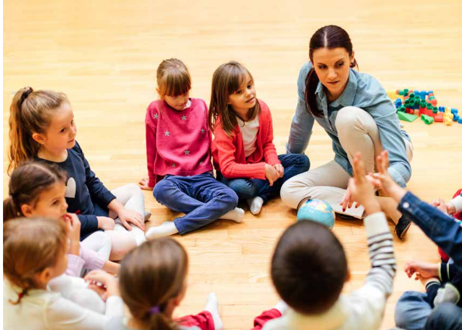
Statements aus dem Projekt in der Steiermark: „Die Kinder finden immer neue kreative Lösungen, an die wir PädagogInnen gar nicht gedacht haben. Ihre Zufriedenheit steigt, wenn sie mitgestalten dürfen.“

Es ist also auch für Kindertageeinrichtungen eigentlich keine Frage des „Ob“, sondern nur mehr eine Frage des „Wie“: Welche Voraussetzungen braucht es von